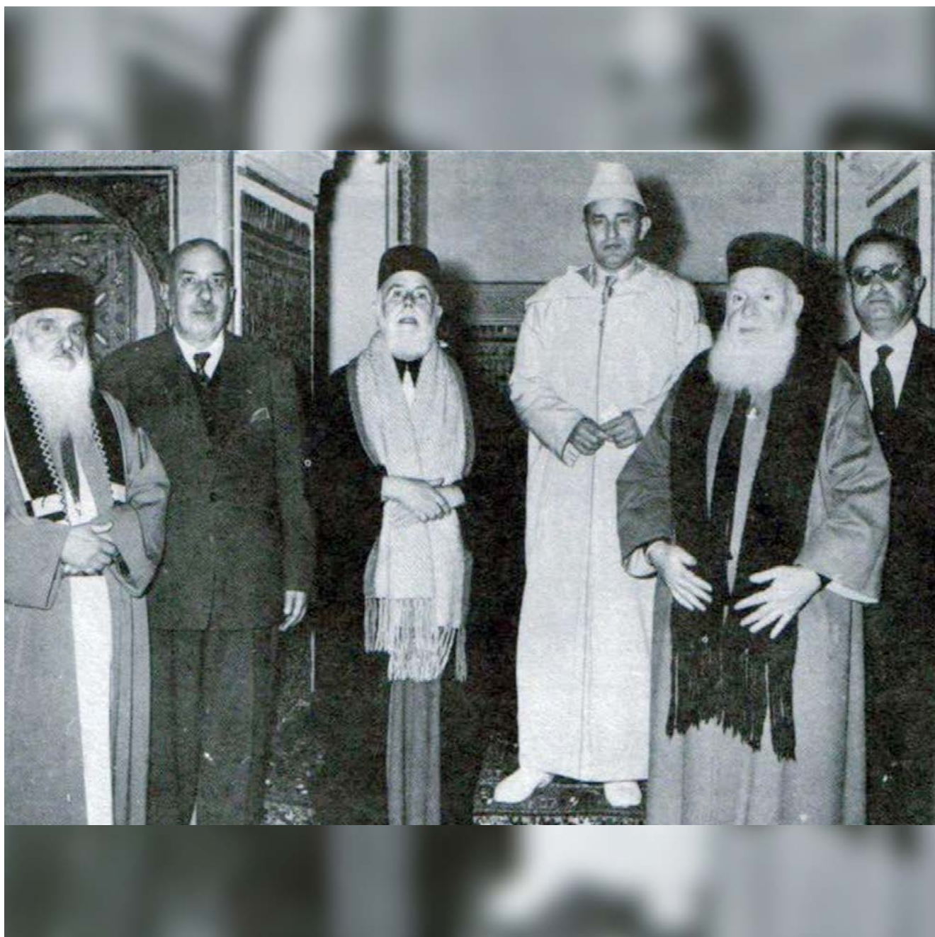
▲ Le Sultan Mohammed V recevant des rabbins à l'occasion de la Fête du Trône.

« Le Roi Mohammed V a toujours protégé les Juifs du Royaume, en particulier des griffes de l'opresseur nazi pendant la Seconde Guerre mondiale. Pour cela, le peuple juif lui en sera éternellement reconnaissant. »