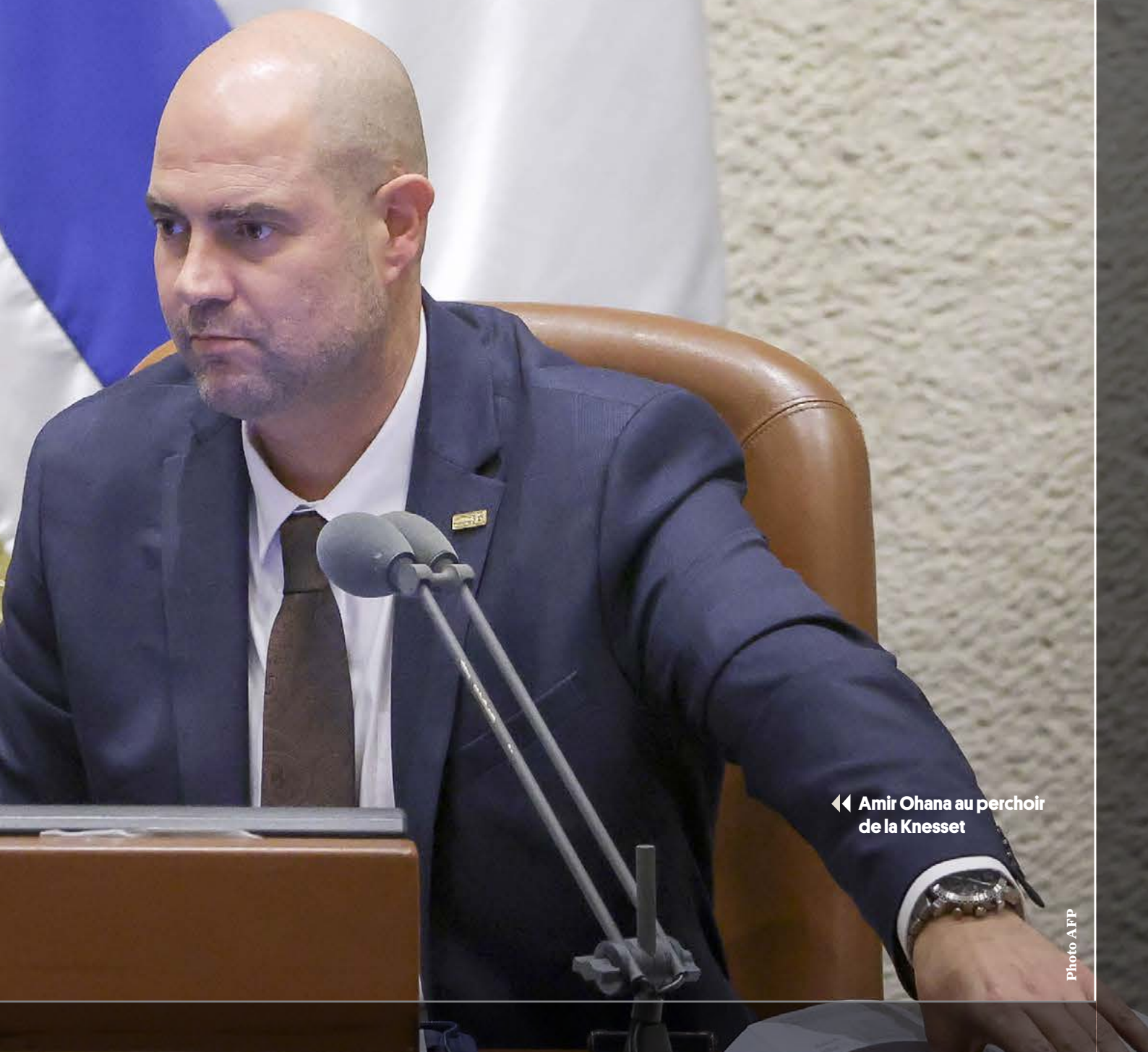
◀ Amir Ohana au perchoir de la Knesset